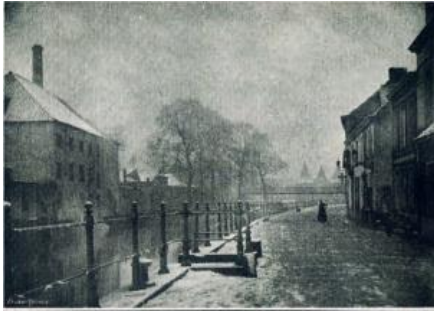
Afb. 3. Sint-Antoniusskaai werd in 1812 de officiële naam van de Lievegang langs de oude Lieve. De vroegere naam bleef behouden voor de aftakking naar het Tolhuis toe (litho van P. Van Duyse, verzameling DSMG, Begijnhof, Sint-Amandsberg).

Het gezin woont op de Sint-Antoniusskaai, een deel van de voormalige 'Lievegang' ( passage de la Lieve ). De 'Lieve' was een kanaal dat vanaf de dertiende eeuw het Gravensteen verbond met het Zwin en in 1872 grotendeels opgevuld en vervangen werd door de Sassevaart, de voorloper van het Zeekanaal Gent-Terneuzen. Op de Sint-Antoniusskaai woonden vooral fabriekswerkers die zich er in de 19 de eeuw tijdens de expansie van vooral de textielindustrie hadden gevestigd. Na de ineenstorting van de textielindustrie vanaf de jaren dertig van de 20 ste eeuw, werd het een eerder armoedige wijk.